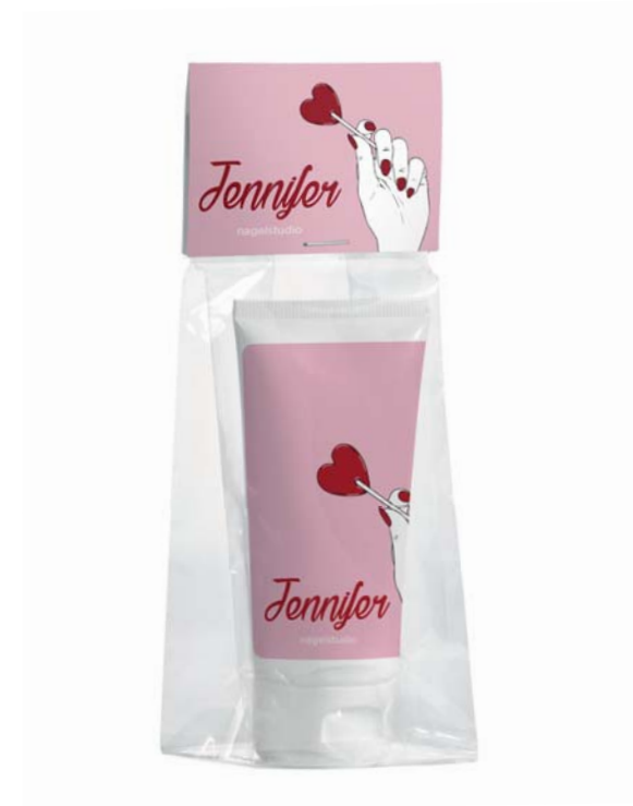
Blokbodenzakje met kopkaart