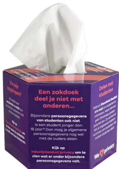
Tissue box hexagon