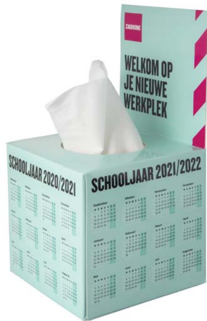
Tissue box met flap