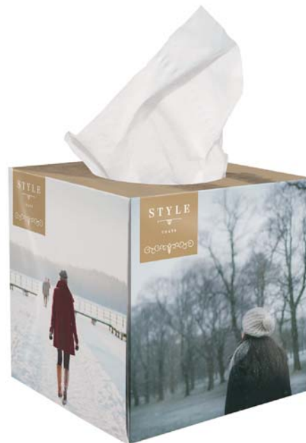
Tissue box large