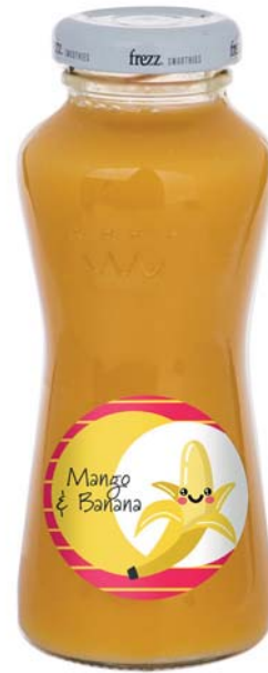
Smoothie catchy yellow