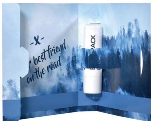
Sample kaart lippenbalsem 7001

omschrijving meerprijs sample kaart voor lippenbalsem, incl. handling formaat 11 x 11 cm bedrukking kaart digitaal 2-zijdig levertijd ca. 3-4 weken na goedkeuring proef