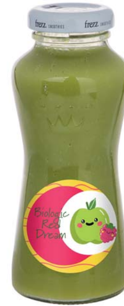
Smoothie lovely green