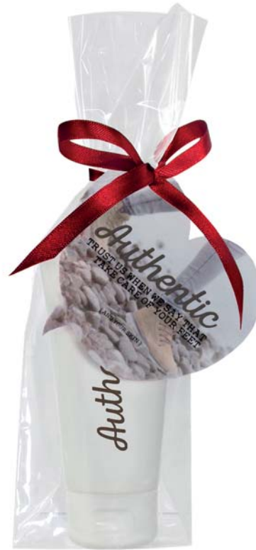
Blokbodenzakje met kaart eigen vorm