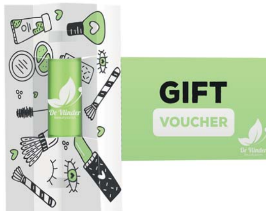
Visitekaart lippenbalsem 7002

omschrijving meerprijs visitekaart voor lippenbalsem, incl. handling formaat 15,5 x 11 cm bedrukking kaart digitaal 2-zijdig levertijd ca. 3-4 weken na goedkeuring proef