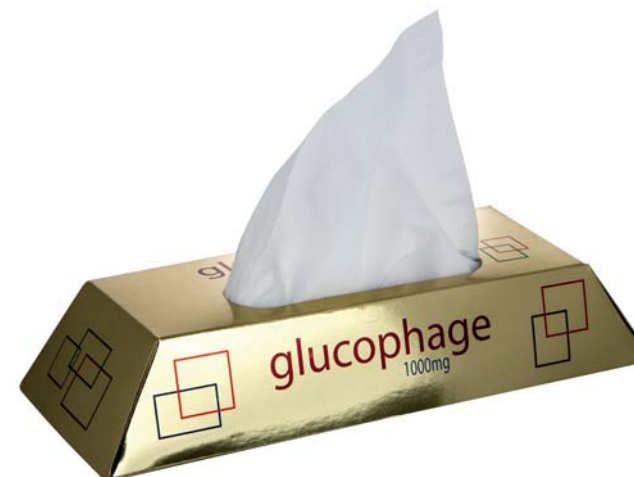
Tissue box goudstaaf