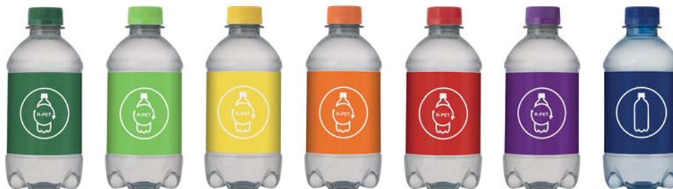
PMS 7733 PMS 360 PMS 115 PMS 1585 PMS 485 PMS 259 PMS 2747