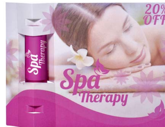
Display kaart lippenbalsem 7003

omschrijving meerprijs displaykaart met lippenbalsem, incl. handling formaat 15,5 x 11 cm bedrukking kaart digitaal 2-zijdig levertijd ca. 3-4 weken na goedkeuring proef