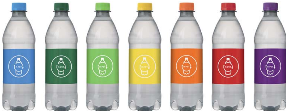
PMS 2193 PMS 7733 PMS 360 PMS 115 PMS 1585 PMS 485 PMS 259