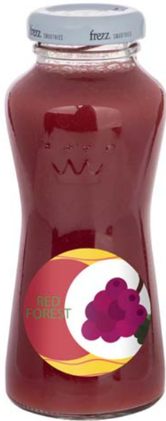
Smoothie red forest