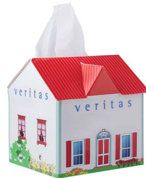
Tissue box huis