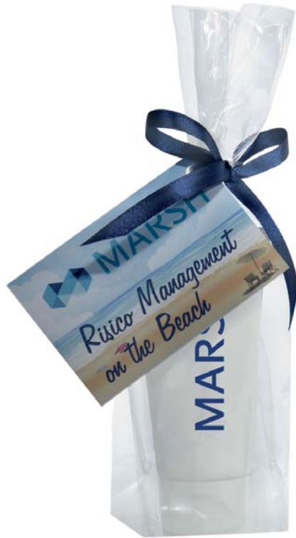
Blokbodenzakje met kaart