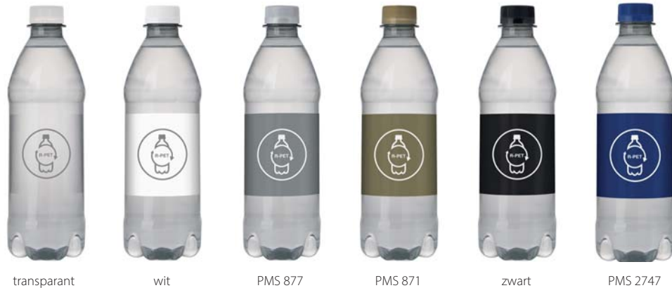
transparant wit PMS 877 PMS 871 zwart PMS 2747