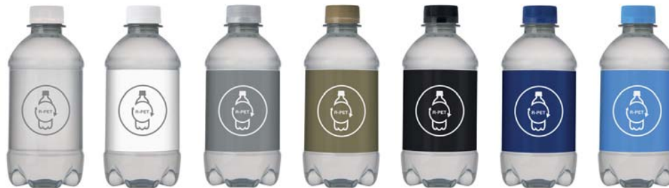
transparant wit PMS 877 PMS 871 zwart PMS 2747 PMS 2193